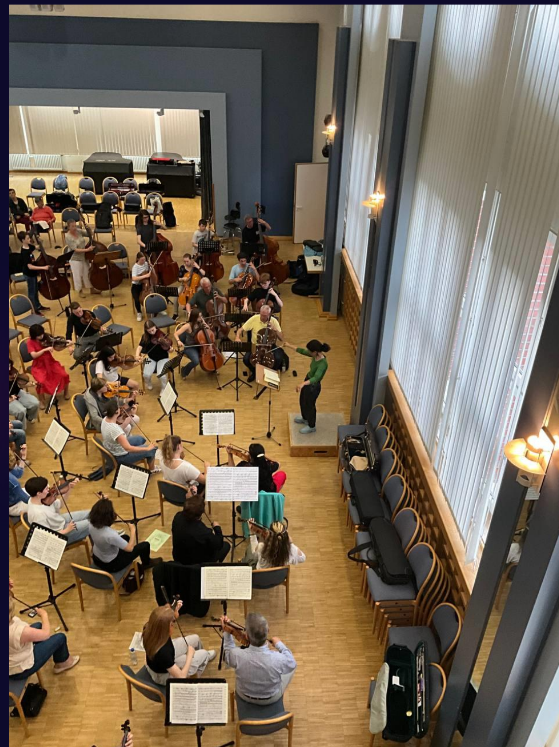
Kennenlernprobe in der Musikschule (15.06.2023)